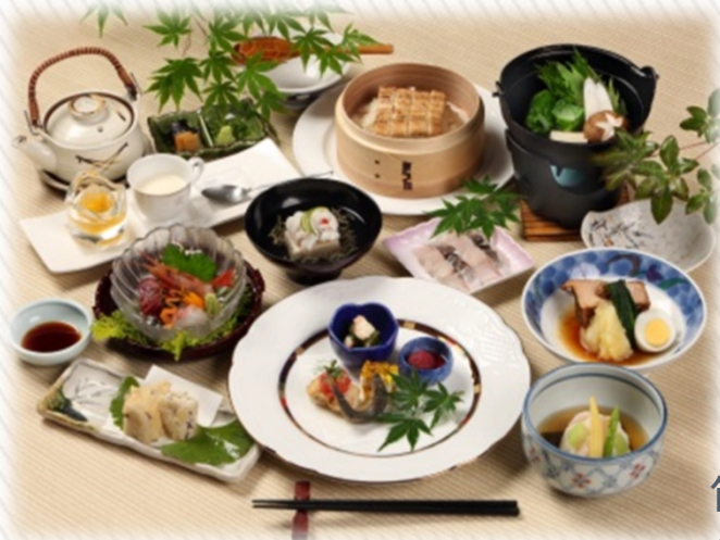
旬のおまかせ 会席コース